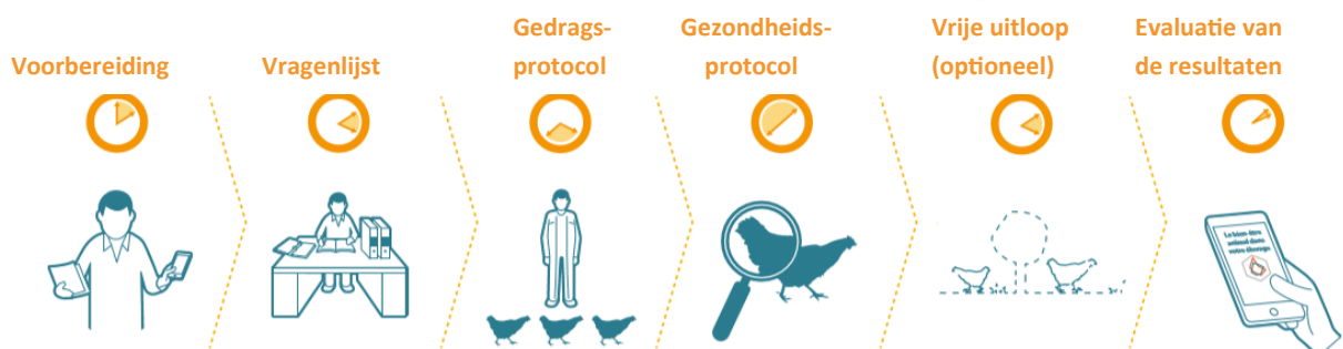
Chronologische schets van verschillende stappen die worden ondernomen bij het volgen van de EBENE-methode

Dit document helpt de gebruikers om de belangrijkste elementen die tijdens de training zijn geleerd, te behouden.