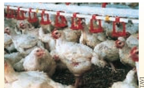
La zone abreuvoir se caractérise par sa teneur importante en humidité

Pour les volailles de chair, les systèmes de goutte à goutte sont fixés sur un tube d'alimentation suspendu dans le bâtiment. La hauteur par rapport au sol varie selon la taille des animaux. Pour l'alimentation en eau de la volaille lourde d'élevage et d'engraissement, comme par exemple les dindes, il est possible d'utiliser des abreuvoirs ronds automatiques, en version suspendue ou posés au sol, équipés de valves pour réguler précisément le niveau d'eau afin