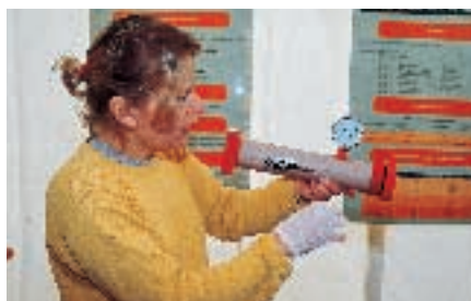
Le Quantofix (photo du haut) et l'Agro-Lisier permettent des analyses rapides